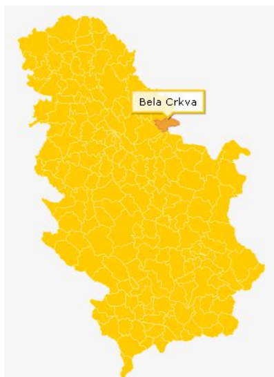
Slika 1: Bela Crkva - geografski položaj