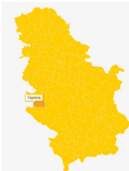
Slika 1: Čajetina-geografski položaj